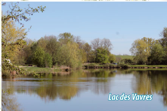
Lac des Vavres

ATTENTION! Traversée de la RD 28 en deux endroits.