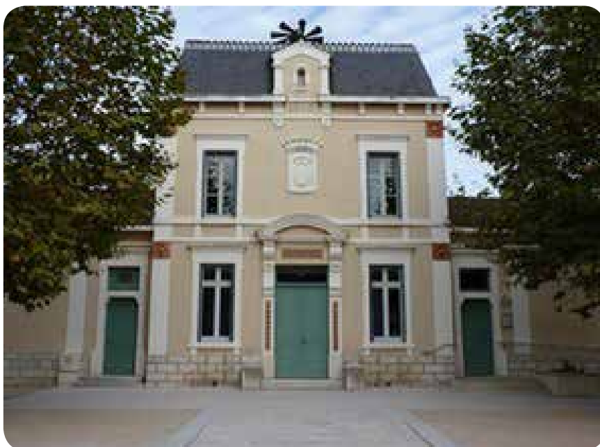
Mairie de Cras-sur-Reyssouze Siège de la Commune Nouvelle

Face à ce changement, vous vous posez sûrement des questions, et pourtant, en dehors de l'organisation administrative, rien ne va changer dans votre quotidien, l'objectif étant de maintenir un service de proximité pour les citoyens.